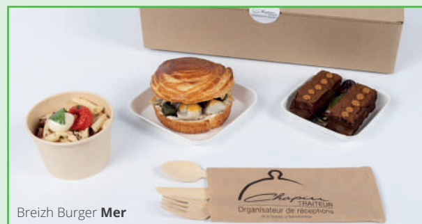
Breizh Burger Mer

Les emballages sont en fibre de canne, en carton et les couvercles en rPet. Le tout est livré dans une box en carton.