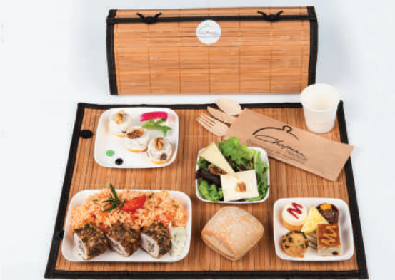
Couverts en écorce de bambou & gobelet en papier de bambou