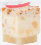
Le Tout Végé