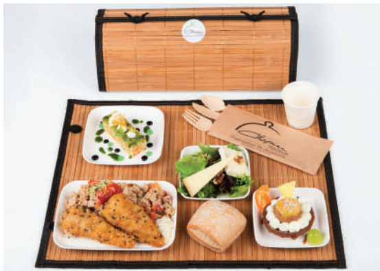
Couverts en écorce de bambou & gobelet en papier de bambou