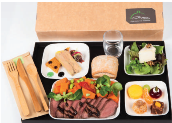
Couverts en bambou premium & verre en verre