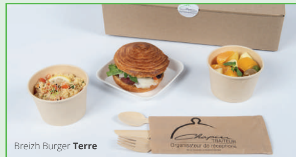
Breizh Burger Terre